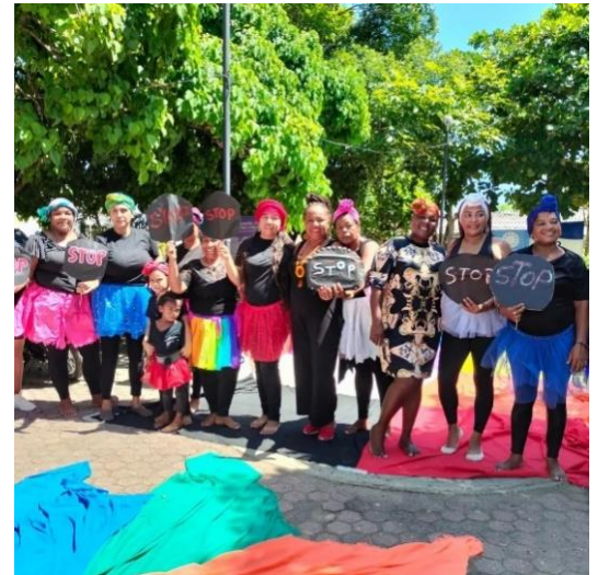
Fotografía: La Seccional Cartagena con las participantes realizaron el Performance: "Cuerpos con historia"

Este año 2023, la Fundación El Buen Pastor realizó varias actividades de sensibilización en alusión al Día Mundial Contra la Trata de personas, donde se contó con la participación de cada una de las seccionales para decirle NO a la Trata. Durante todo el mes de julio la campaña de prevención contra la Trata de personas estuvo enfocada en identificar cómo opera la Trata. A su vez, se gestionaron varias actividades: Talleres de prevención, incidencia con las comunidades, performance y plantones en la terminal de Transporte de Cali y Medellín.