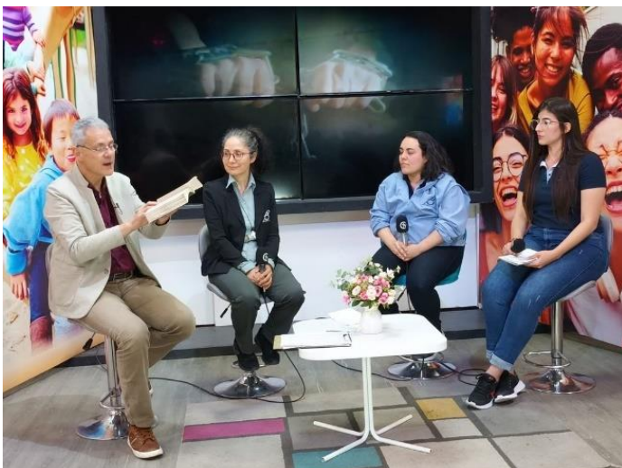
Fotografía: La Fundación El Buen Pastor es invitada al canal Cristovisión para hablar sobre la Trata de personas.

Se tuvo la participación de algunas organizaciones como: La Organización Internacional para las Migraciones-OIM, la Junta de Acción Comunal-JAC de Palmira-Cali, y la Fundación Aescena; quienes desde su rol social contribuyeron a fortalecer diálogos entorno a la Trata. Se hizo presencia en algunos medios de comunicación, entre ellos: