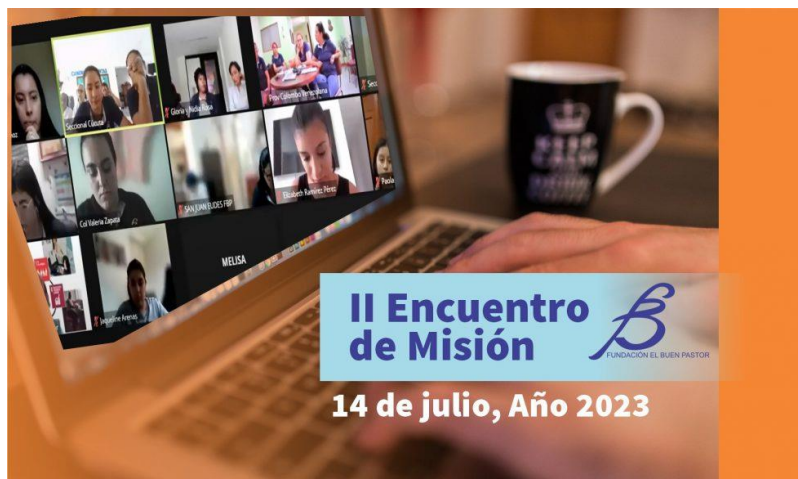
Fotografía: Captura de pantalla al II Encuentro de Misión, realizado a través de la plataforma Zoom.

El pasado 14 de julio del 2023 se desarrolló a través de la plataforma Zoom el II encuentro de misión, contando con la participación del equipo estratégico, los equipos de las seccionales de la Fundación El Buen Pastor (FBP) presentes en Cartagena, Cúcuta, San Juan Eudes (Medellín), Manizales, Palmira-Cali, Centro Esperanza sede ubicada en la ciudad de Caracas-Venezuela y voluntarias laicas.