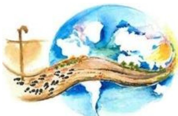
Logo: Comité de nuevas direcciones para la Nueva Gobernanza

Como iniciativa del Equipo de Liderazgo Congregacional, se convoca al encuentro en Lima-Perú, desde el 20 de septiembre hasta el 4 de octubre de 2023. En este espacio 120 Hermanas provenientes de América Latina, están profundizando el tema "Guiadas/os por el Espíritu: encarnando nuevas formas de ser líderes y miembros", construyendo diálogos a partir de la estructuración de una nueva